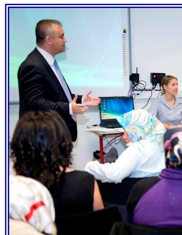
Collège Pierre Curie de Goussainville

Outre l'application du plan départemental d'intégration des populations immigrées appelé à être actualisé en 2011, le programme 104 "Intégration et accès à la nationalité française" a permis de financer nombre d'actions en direction de ce public, notamment pour l'acquisition du français dans le cadre des ateliers sociolinguistiques .