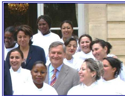
Les 15 femmes en avenir" ont été reçues à l'hôtel de Matignon par le Premier ministre

Une attention particulière a été donnée pour encourager les initiatives réduisant les difficultés les plus caractéristiques des demandeurs d'emploi issus des zones urbaines sensibles : parrainage des jeunes, formation diplômante pour les jeunes sans qualification (opération « 15 femmes en avenir », formées par les équipes d'Alain Ducasse), chantiers d'insertion liés à la rénovation urbaine.