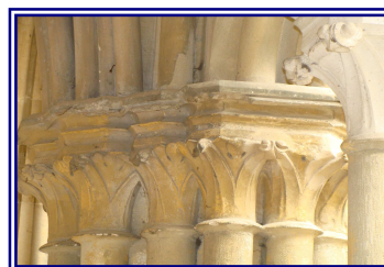
Pilastres à Royaumont

La culture a bénéficié des appels à projets du ministère de la culture qui a permis de financer des actions ponctuelles, d'associations et d'institutions locales.