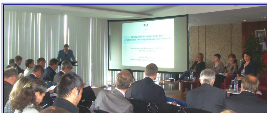
Séminaire de travail sur « la formation et l'alternance »

- Le dispositif local d'accompagnement (DLA) a permis l'accueil de 109 structures associatives, l'établissement de 92 diagnostics et l'accompagnement en ingénierie de 74 structures.