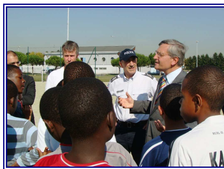
Centre départemental de loisirs des jeunes de la police nationale - Villiers le Bel.

La prévention de la délinquance s'est notamment appuyée sur les opérations "Ville Vie Vacances" auxquelles plus de 300 000 € ont été consacrés.