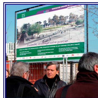
Rénovation urbaine à Argenteuil